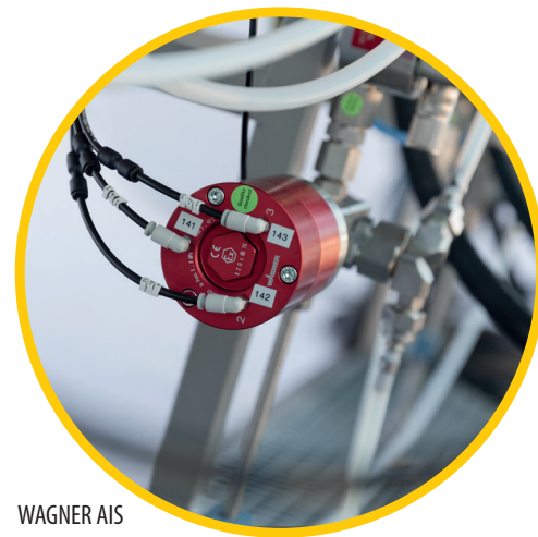
WAGNER AIS (Adaptive Injection System)