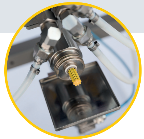
WAGNER Cage-Filter mit Tropfschale

Die 2K Smart C wird auf einem stabilen, rollbaren Gestell (inkl. Tropfwanne) geliefert, das je nach Anzahl der integrierten Pumpen in verschiedenen Größen erhältlich ist. Die Steuerung kann je nach Explosionsschutz-Anforderung separat oder direkt auf dem Gestell integriert werden.