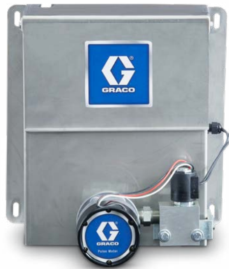
Materialkonsole mit Volumenzähler für Öl für Schmierstoff und Öl