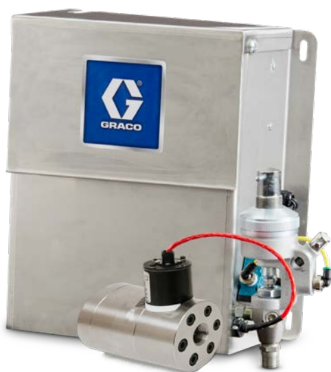
Materialkonsole mit Schrägstirrad-Durchflussmesser für hochviskose Materialien