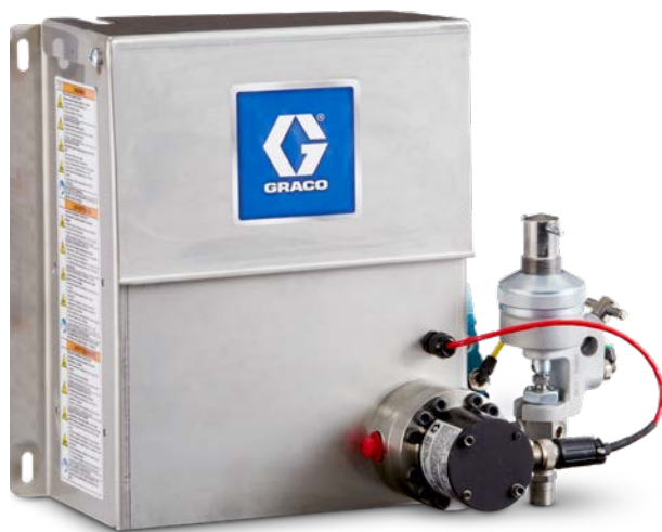
Materialkonsole mit Volumenzähler G3000 für Schmiermittel und Farbe

Sieben Materialkonsolenkonfigurationen für ein breites Spektrum an Materialien, Viskosität und Durchflussraten